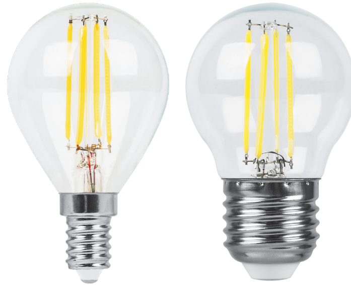
Арт. 38001, 38002, 38013, 38014